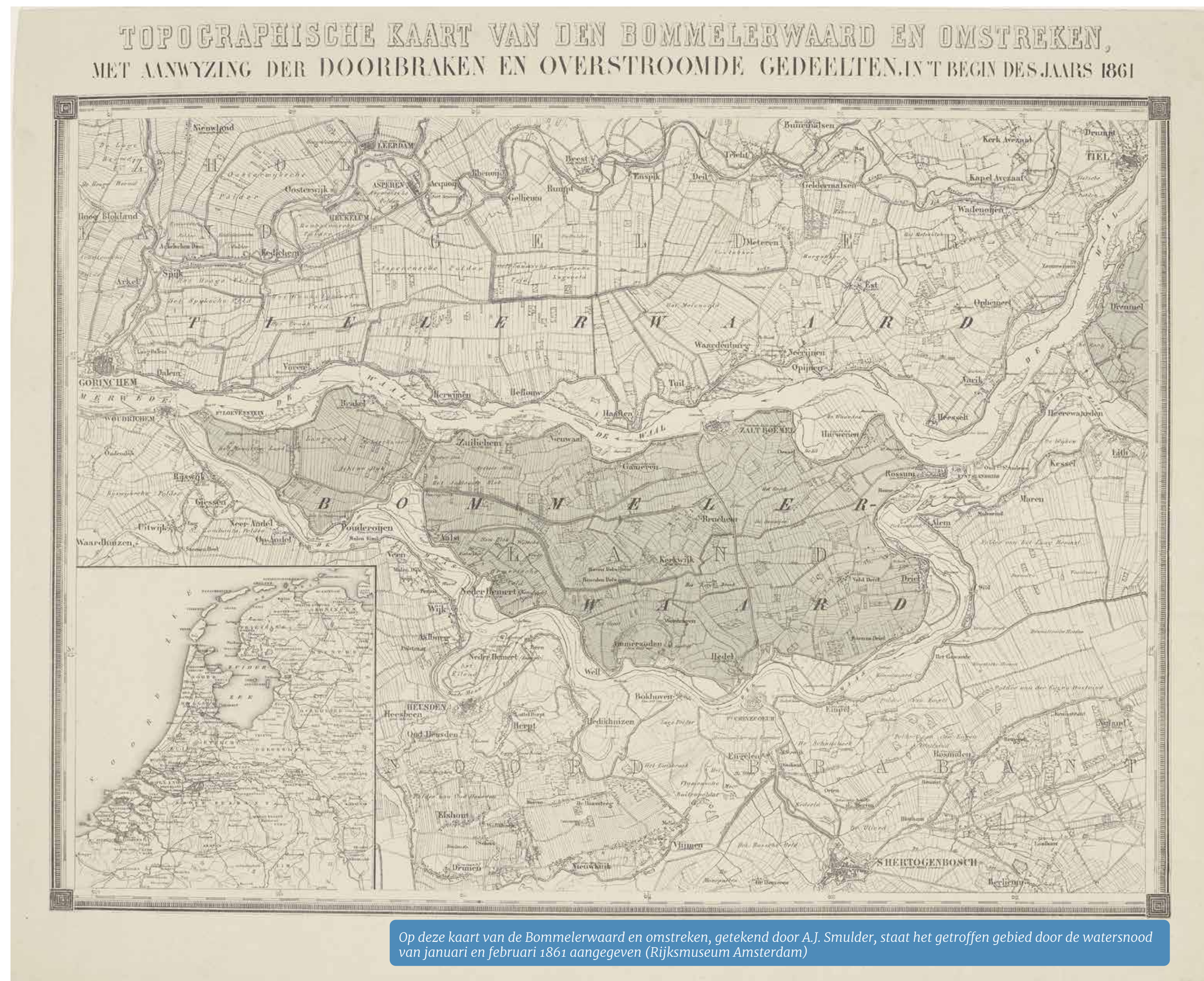
Op deze kaart van de Bommelerwaard en omstreken, getekend door A.J. Smulder, staat het getroffen gebied door de watersnood van januari en februari 1861 aangegeven (Rijksmuseum Amsterdam)