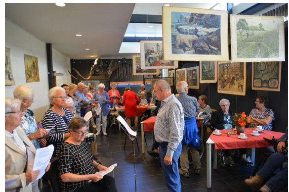
Bezoek van de bewoners van Elisabeth. Trug in de ted verzorgt de vrolijke noot