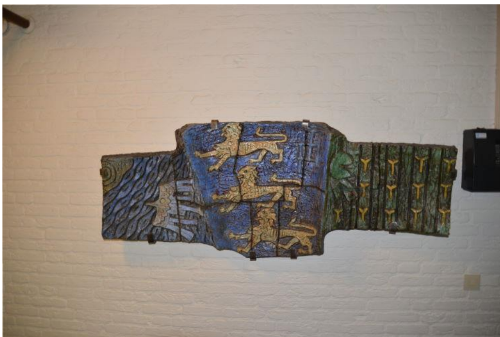
Plastiek van Jac Maris; schenking van basisschool de Leeuwenkuil, mei 2019