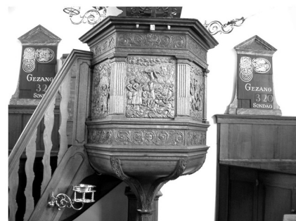
De preekstoel met de zes (vijf zichtbaar) panelen

Kwamen er belangrijke brieven in het dorp binnen, dan werden die 's zondags vanaf de preekstoel in de kerk voorgelezen. De kerk was dus de grote nieuwspoort waardoor al het nieuws naar het dorp ging.